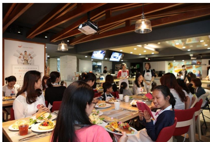
圖／終於大功告成！和家人一起共享今天的成果