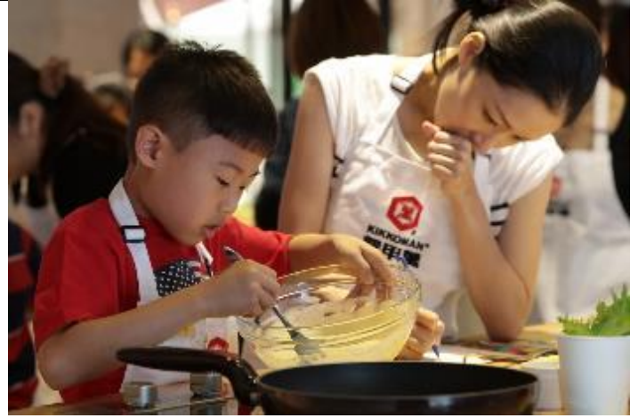
圖／小朋友個個都是媽媽的小幫手