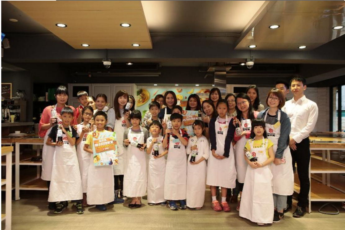
圖／結束完美的週末下午，大家一起開心大合照